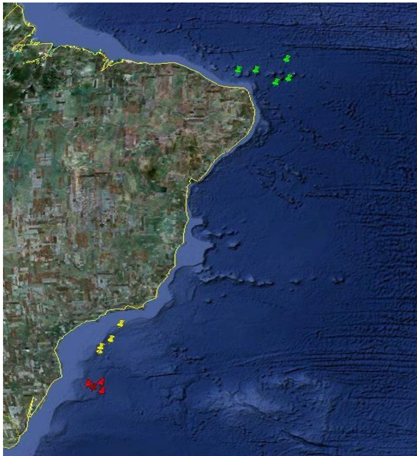
Figura 1 - Localização dos pontos de coleta no oeste do Oceano Atlântico Sul. As marcações em vermelho representam coletas do Rio Grande do Sul (RS); marcações

Foram obtidas 97 amostras de Prionace glauca nos locais de desembarque de frotas industriais e a bordo de pesqueiros que capturam tubarões e raias ao longo da costa brasileira. Essas amostras são provenientes do Rio Grande do Sul (n=38, entre 27°15'S e 30°20'S), São Paulo (n=31, entre 24°40'S e 26°57'S) e Rio Grande do Norte (n=28, entre 2°38'S e 4°52'S) (Figura 1).