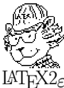
Figura 1 - Exemplo de uma figura.

No exemplo da Figura 1, temos como se coloca a figura no texto. No exemplo da Figura 1, temos como se coloca a figura no texto. No exemplo da Figura 1, temos como se coloca a figura no texto.